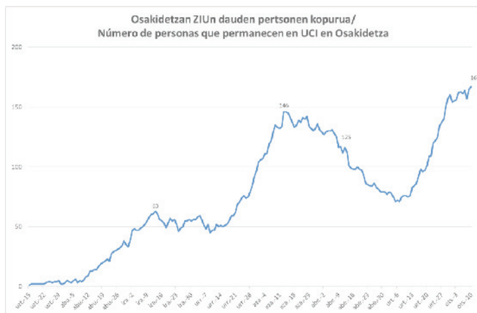
Gráfica 2.

A primeros de abril, se alcanza la cifra más alta de personas fallecidas, 51 en una solo semana. En esta primera gráfica podemos comprobar que, en el segundo pico epidémico de la segunda ola, a mediados de noviembre, es de 26. Desde entonces, en el tercer pico epidémico, todavía no se ha alcanzado esta cifra. Desde principio de marzo de 2020 y final de enero de 2021, el número total de personas fallecidas en Euskadi por COVID-19 es de 3.291. Este dato es el reflejo más duro de la realidad del impacto de la COVID-19