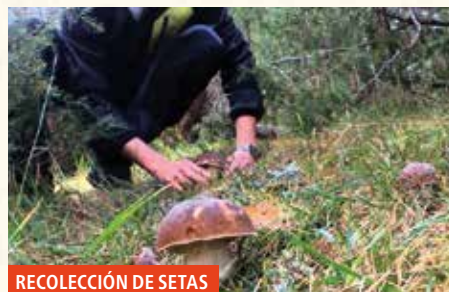
RECOLECCIÓN DE SETAS