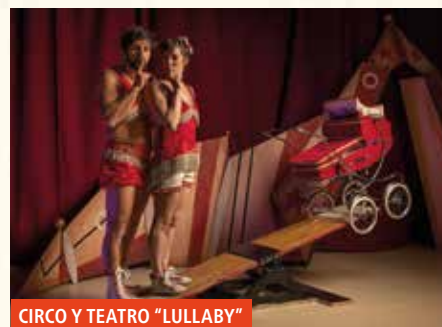
CIRCO Y TEATRO "LULLABY"

18:30 DESFILE DE DISFRACES de cuadrillas desde Madalena hasta el parque Ibaizabal. Al finalizar, sorteo de premios. Inscripción: del 2 al 19 de octubre en Intxaurreondo.