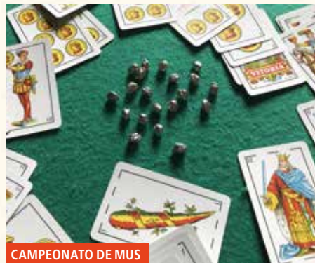
CAMPEONATO DE MUS

Comienzo de los CAMPEONATOS DE MUS, TUTE, BRISCA, RANA, BILLAR Y PING-PONG para personas mayores. Inscripción gratuita desde el 3 al 8 de octubre en la cafetería del centro municipal de personas mayores. Adjudicación de plazas el 9 de octubre mediante sorteo. Colabora: Cafés Baqué.