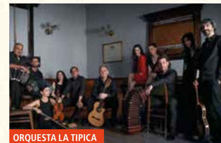
ORQUESTA LA TIPICA