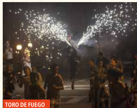
TORO DE FUEGO

21:00 TORO DE FUEGO en el barrio de San Fausto.