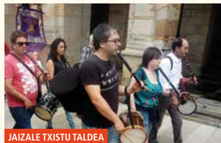
JAIZALE TXISTU TALDEA

11:00–14:00 JUEGOS INFANTILES en el parque Ibaizabal. (En caso de mal tiempo, en el colegio San Antonio).