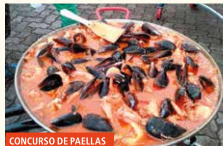
CONCURSO DE PAELLAS

11:00 CONCURSO DE PAELLAS en el barrio de San Fausto.