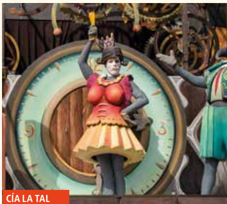
CÍA LA TAL

16:00-19:00 PARQUE INFANTIL en el colegio Landako. (En caso de mal tiempo, en el frontón del colegio Landako).