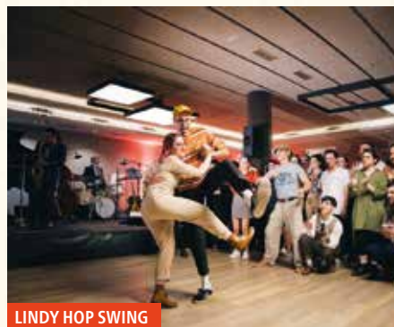
LINDY HOP SWING

17:30 JUEGOS INFANTILES en el barrio de San Fausto. (En caso de mal tiempo, en el frontón San Fausto). Organiza: Centro Social San Fausto.