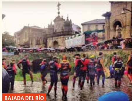
BAJADA DEL RÍO

17:00 CHOCOLATADA en el barrio de San Fausto. (En caso de mal tiempo, en el frontón San Fausto). Organiza: Centro Social San Fausto.