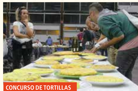
CONCURSO DE TORTILLAS

18:30 Exhibición de tangos en Plateruena Kultur Aterpea con ORQUESTA LA TIPICA (dentro de los actos de hermanamiento entre Montevideo y Durango). Exhibición de baile y, a continuación, milonga.