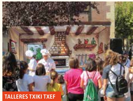
TALLERES TXIKI TXEF

13:15 Concierto de la BANDA DE MÚSICA TABIRA en Plateruena Kultur Aterpea.