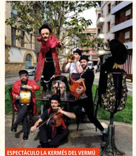
ESPECTÁCULO LA KERMÉS DEL VERMÚ

13:00 TXUPINAZO en la plaza del ayuntamiento (habrá intérprete de lengua de signos). Txupinero/a de 2023: MUGARRA TRIATLOI TALDEA. GORA SAN FAUSTO JAIK!