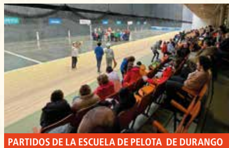
PARTIDOS DE LA ESCUELA DE PELOTA DE DURANGO

14:30 Comida de "Gazte eguna" en las txosnas.