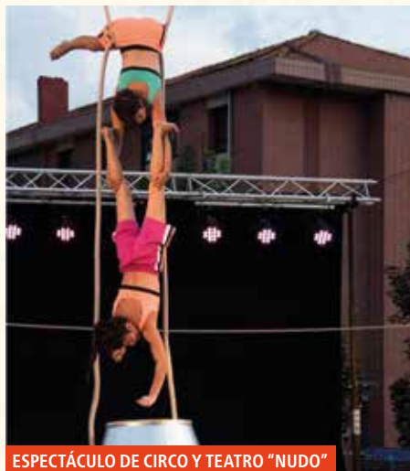
ESPECTÁCULO DE CIRCO Y TEATRO “NUDO”

22:00 Concierto en Ezkurdi: RAIMUNDO EL CANASTERO .