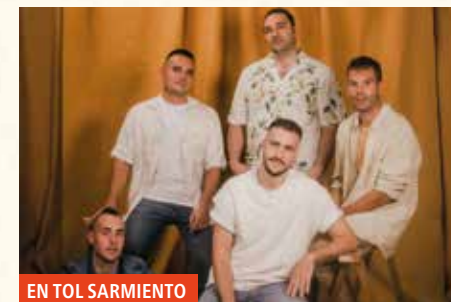
EN TOL SARMIENTO